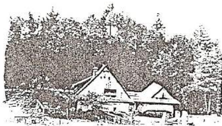
Horákův dolní mlýnek („mlejnek“) č.355 v Dolní Dobrouči

V sedmdesátých letech byl zčásti zbořen, zachováno zůstalo torzo obytné části s patrem a střešou.