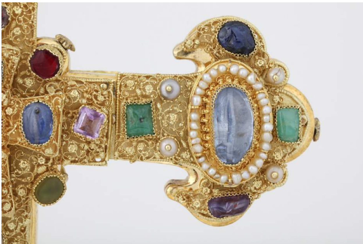
Horní příčné břevno pravé a část pně se středovým křížkem na čelní straně Závishova kříže