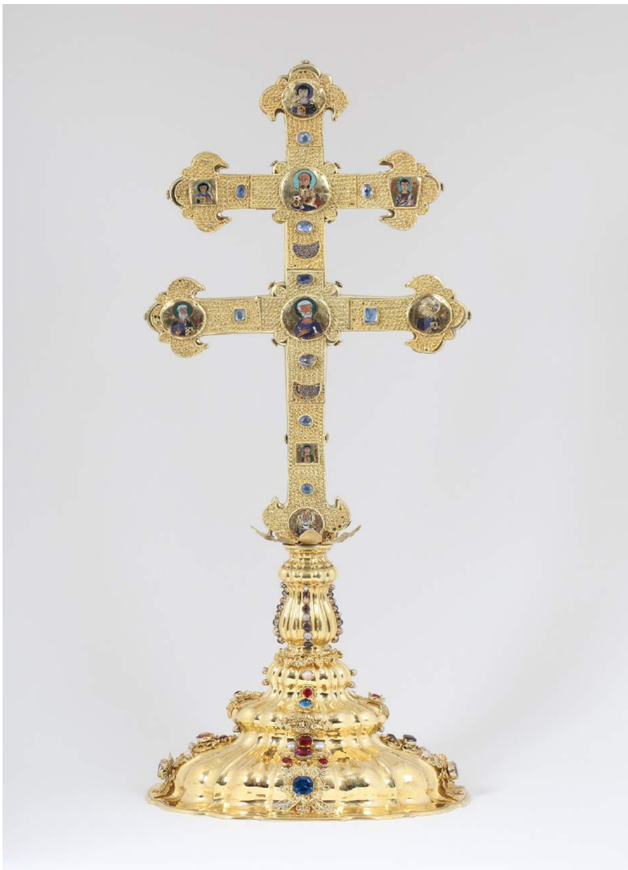
Rubní strana kříže zvaného Závišův