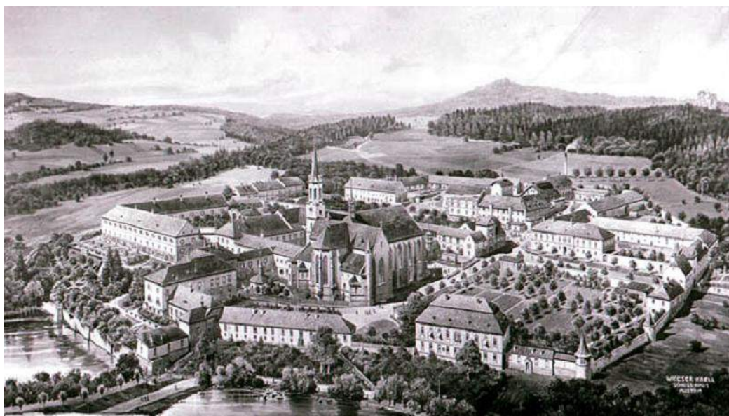
Vyšebrodský cisterciácký klášter

Kříž byl součástí klášterních sbírek do 14. října 1949, kdy byl veškerý majetek kláštera zestátněn. Kříž Záviše z Falkenštejna putoval do chrámového pokladu katedrály sv. Víta na Pražském hradě. Domů se k cisterciáckým mnichům vrátil v roce 1990 po pádu totalitního socialismu.