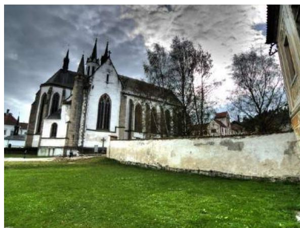
Cisterciácký klášter ve Vyšším Brodě nad Vltavou a klášterní kostel Nanebevzetí Panny Marie