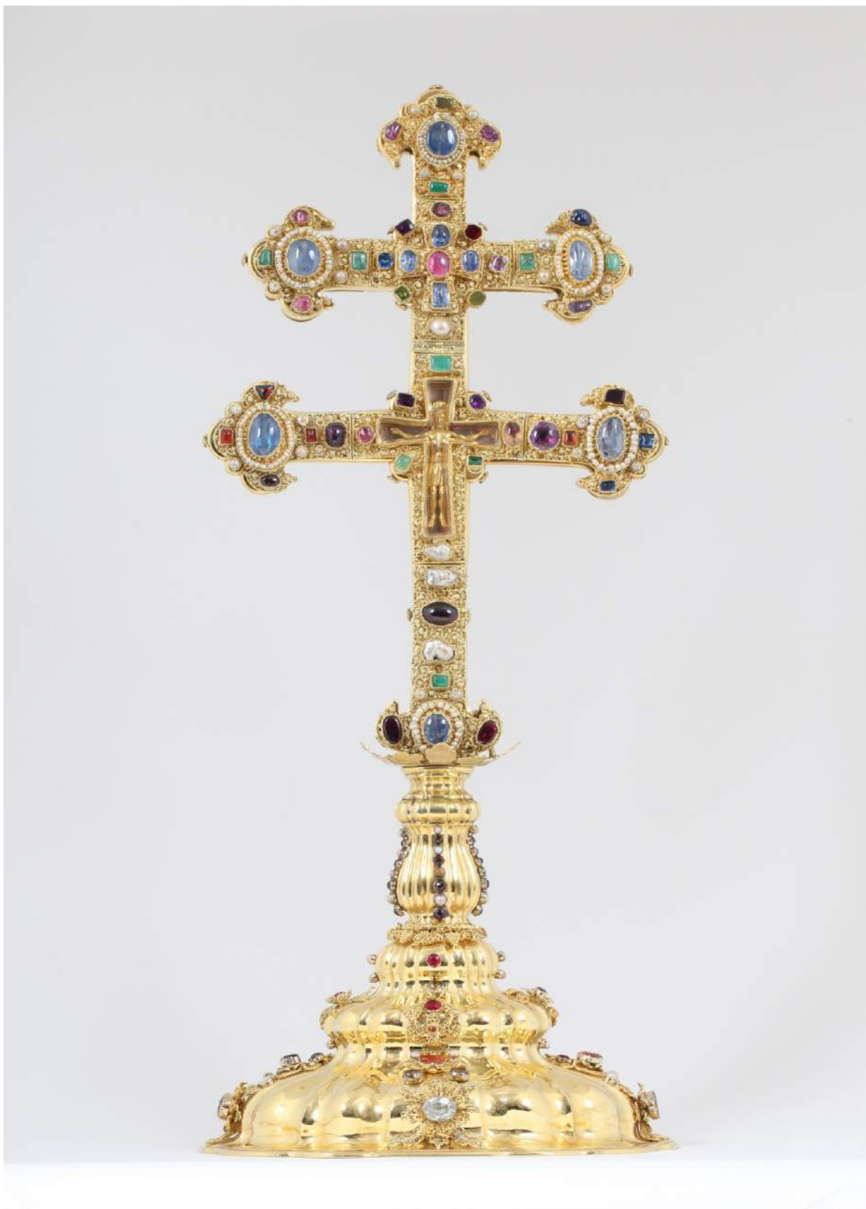
Čelní strana kříže zvaného Závišův