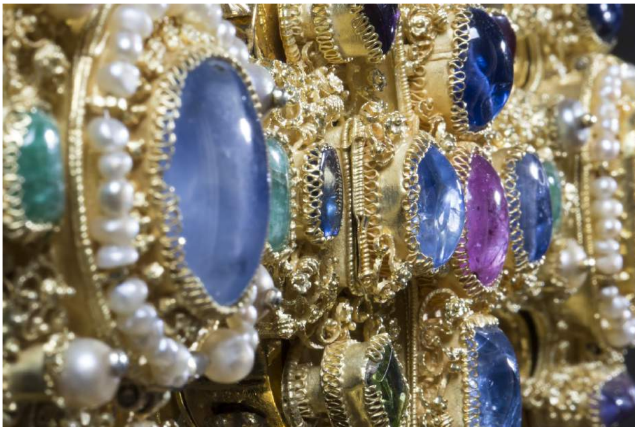
Detailní pohled na horní křížení čelní strany Závěšova kříže