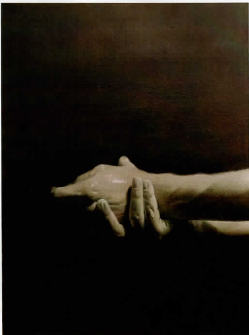
Křížová cesta - zastavení I. Ježíš odsouzen k smrti