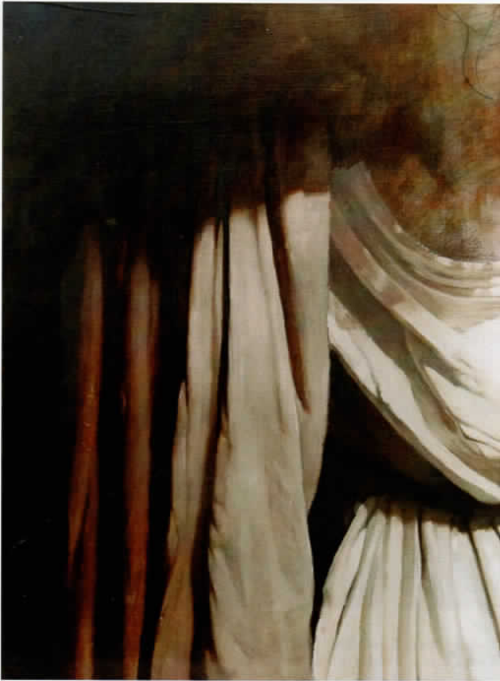
Křížová cesta - zastavení VIII. Plačící ženy