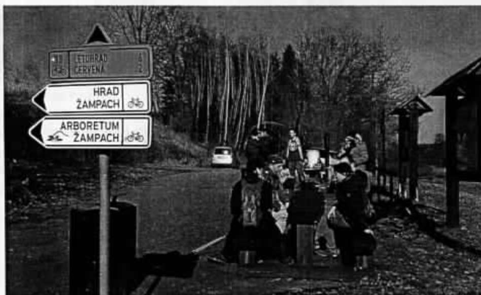
březen 2017 – kontrola nedaleko Valdštejna