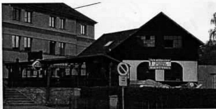
11/2016 bývalá „Skoba“ v rekonstrukci