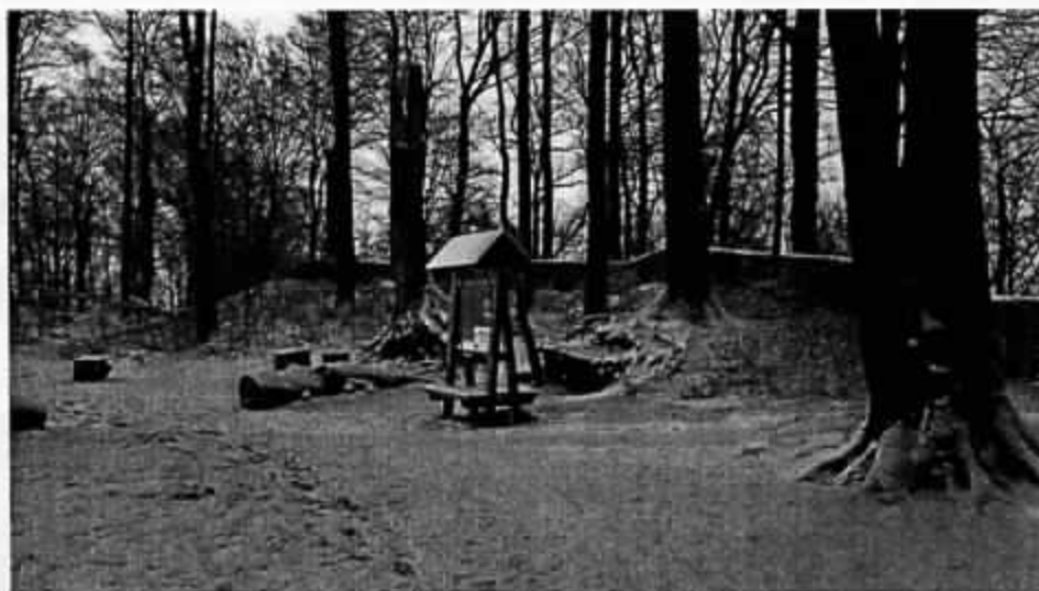
Hrad Žampach, prosinec 2014