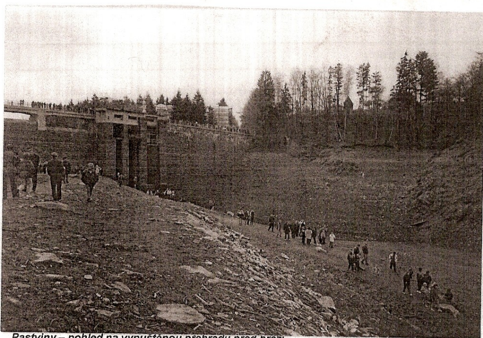
Pastviny – pohled na vypuštěnou přehradu před hrází

Nový zámecký okruh na Litomyšli – Pro letošní rok Památkový ústav Pardubice připravil druhý vycházkový okruh na zámku v Litomyšli. Ukazuje klasicistní interiéry tak, jak vypadaly koncem minulého století. Rekonstrukce byla provedena přesně podle dochovaných inventářů.