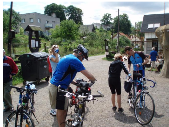
Na startu cykloakce Lanšperským panstvím

Podle ohlasů se soutěžícím nová akce líbila. Je sice náročná a účastníci přijeli dosti unavení, o zážitky ale jistě neměli nouzi. Týmu „Fanoušci“ se na samém konci závodu podařilo pchnout kolo, takže jeden ze soutěžících poslední kousek doběhl. Vítězná partnerská dvojice pak líčila své dojmy tak, že to jednu chvíli vypadalo na rozvod, když se nemohli shodnout na dalším směru cesty. (Z vlastní zkušenosti z podobné soutěže můžu potvrdit, že taková soutěž vztah důkladně prověří). Všechny tyto